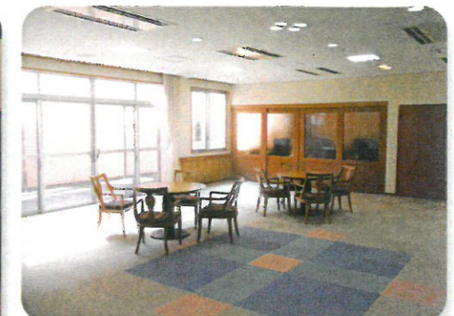
地域交流スペース