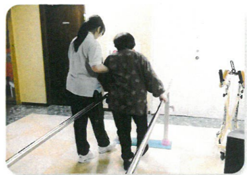
機能訓練コーナー