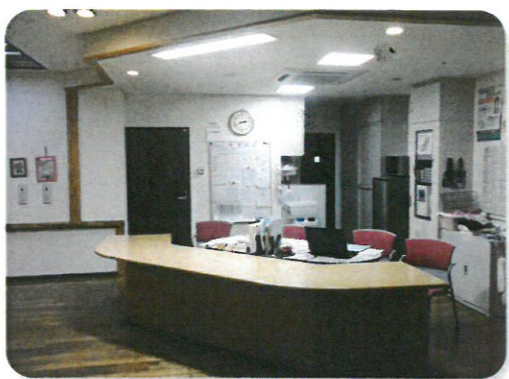
介護ステーション