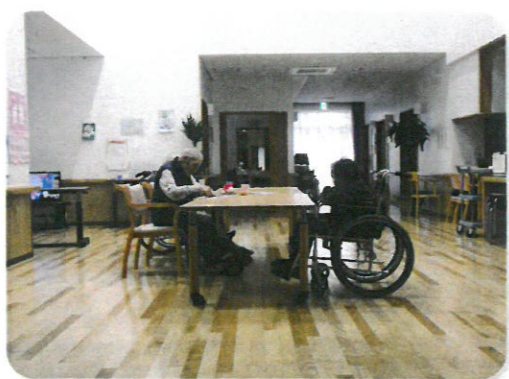
やまゆりデイクーナー